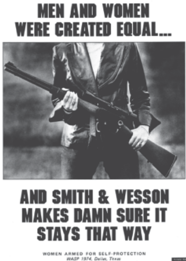
FIGURA 1 – Cartaz da Women Armed for Self Protection (WASP)