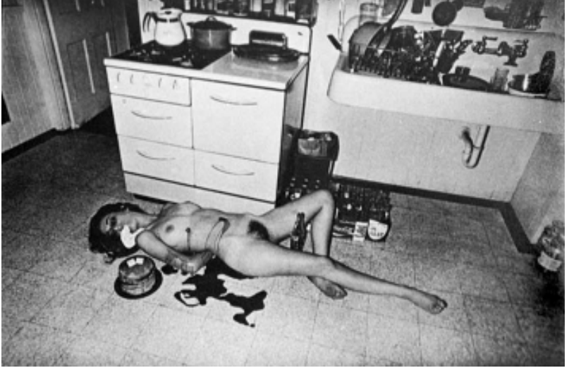
FIGURA 3 – The Incredible Case of the Stack O`Wheats Murders (2)

“As poses revelam muito menos acerca da luta e da rendição, do que da provocação e sensualidade”.