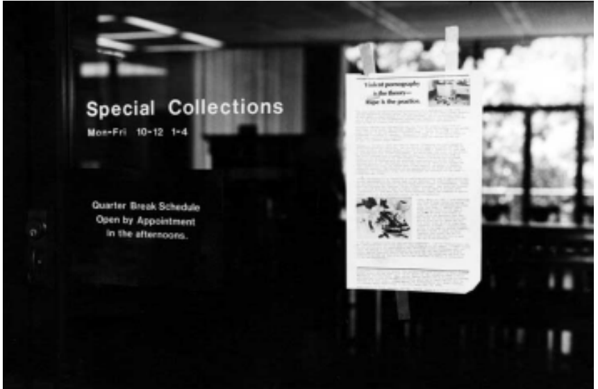
FIGURA 2 – The Incredible Case of the Stack O´Wheats Murders (1)