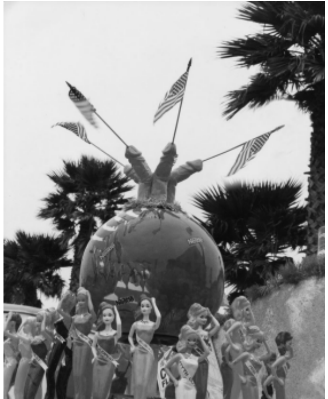
FIGURA 5 – Myth California