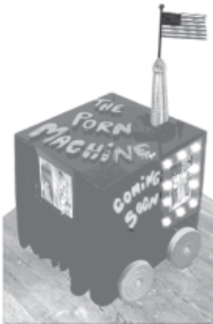
FIGURA 7 – The Porn Machine