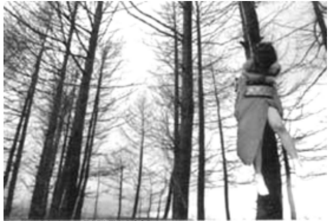
FIGURA 12 – Protesto de feministas contra a pornografia, com a ênfase de que não se opõem à nudez e à sexualidade